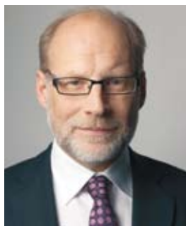
Bostadsminister Stefan Attefall (KD)

Den stora frågan vid årets kongress var ett förslag från förbundsledningen om att kongressen skall hållas vart fjärde år mot f.n. vartannat. I förslaget ingick även att en årsstämma skall hållas varje år i maj månad med 3 delegater per region. Inom respektive region kan även regionmöten hållas vartannat år, då bl.a. delegater till årsstämman kan utses. Den tidsmässiga fördelningen finns grafiskt representerad under "Ny kongressordning". Förbundsledningens motivering för förslaget var att en kongress engagerar stora resur-